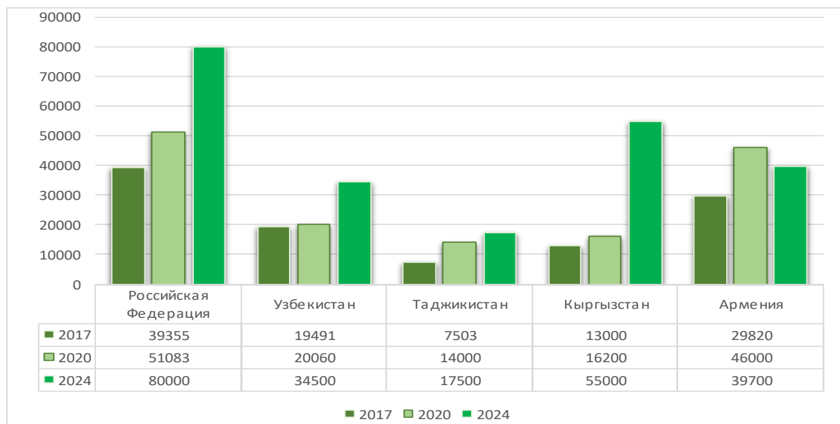
Рис. 2. Соотношение уровней средней заработной платы в рублях в России и других постсоветских странах

2) низкий уровень заработных плат в постсоветских странах по сравнению с Россией. Согласно сведениям, предоставленным Росстатом средняя заработная плата в России находится в пределах 75 – 85 тыс. рублей 31 . В постсоветских, например (в рублях): Таджикистане – 17 500 тыс. рублей 32 ; Кыргызстане – 55 700 тыс. рублей 33 ; Узбекистане 34 500 тыс. рублей 34 (см. рисунок 2);